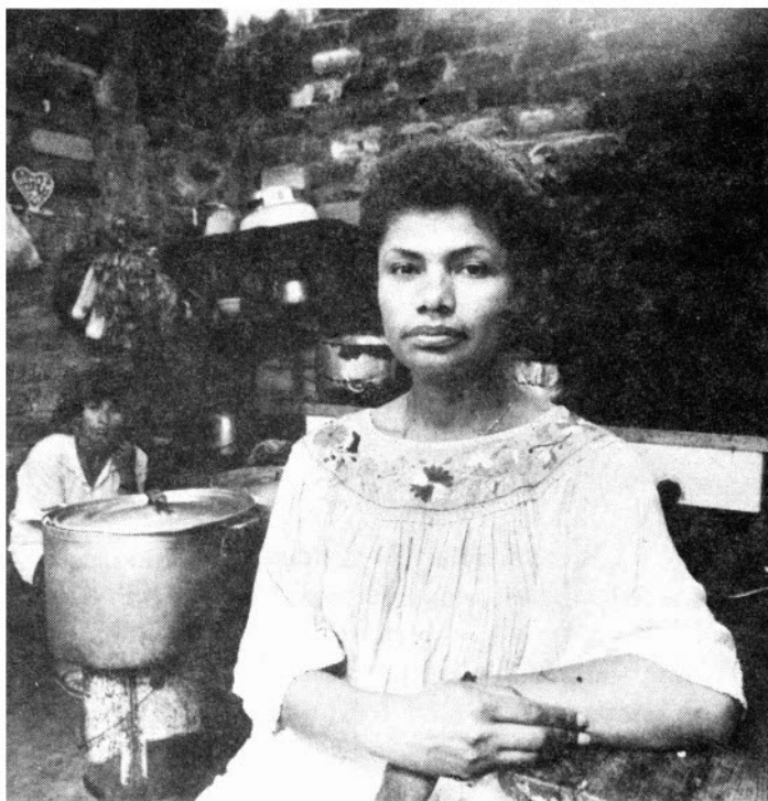
María Elena Moyano en Villa El Salvador