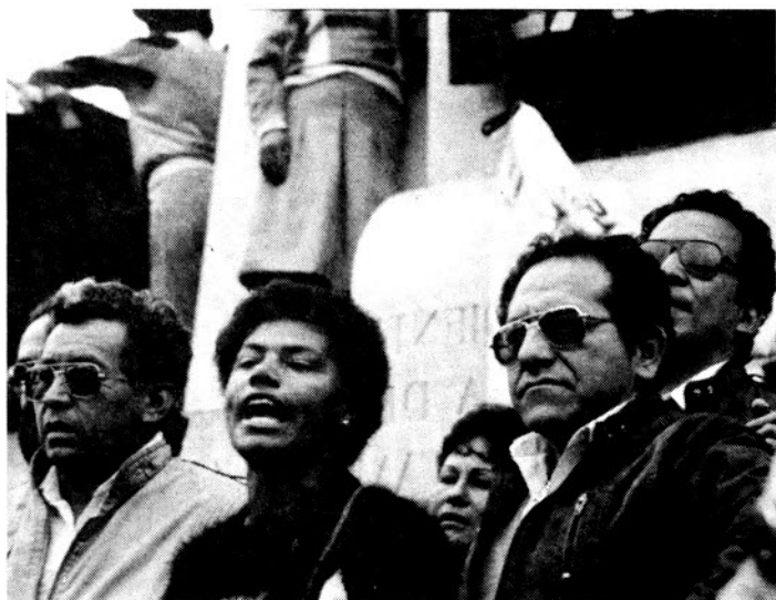
Manifestación en la Plaza San Martín