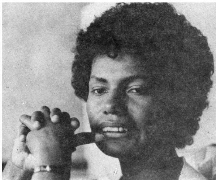
María Elena Moyano