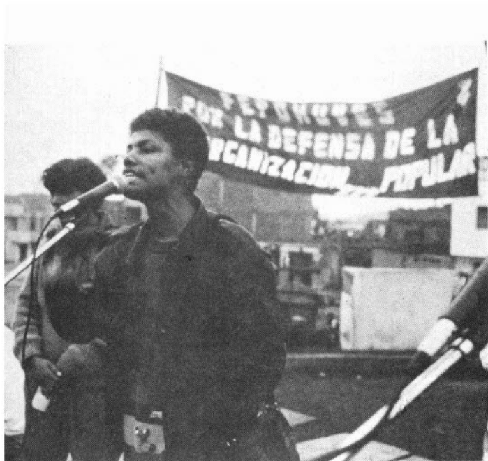
Mitin de la FEPOMUVES.