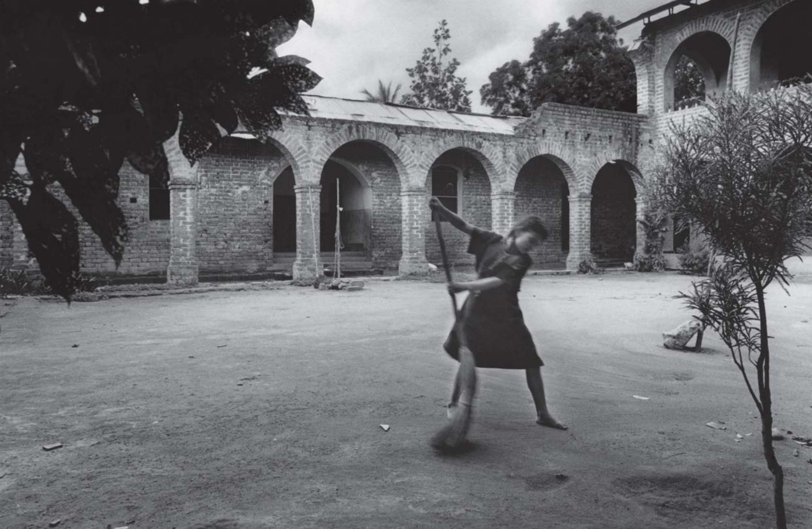
Nelly barre el patio de la misión de Puerto Ocopa. Ingresó al orfanato cuando tenía 5 años y se quedó hasta los 16. Actualmente tiene dos niños y vive en el pueblo con su pareja, también huérfano de la guerra. Puerto Ocopa, Junín (Perú), 1998