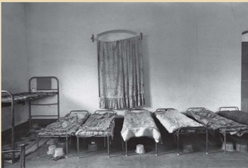
Dormitorio de niñas Puerto Ocopa, Junín (Perú), 1995