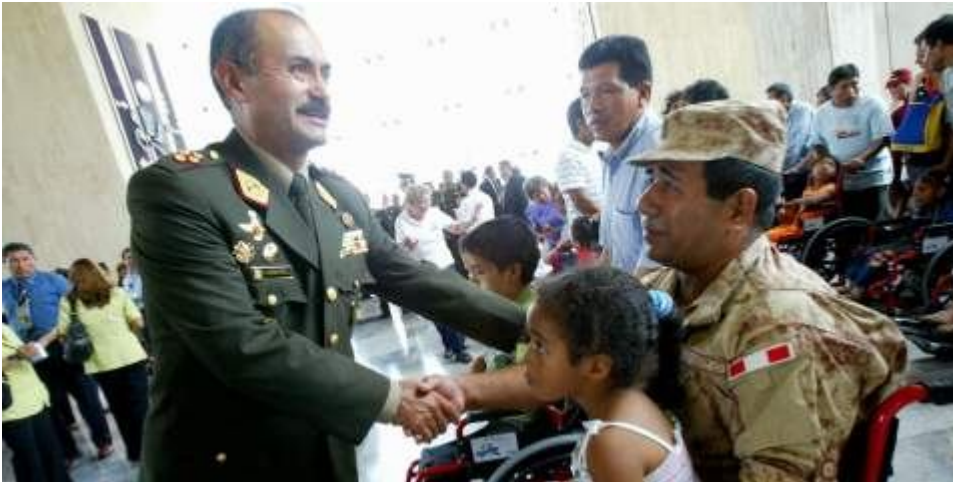
Guibovich encabezó la ceremonia de entrega de sillas de ruedas a militares discapacitados.

El comandante general del Ejército, Otto Guibovich, apoyó la construcción de un museo de la memoria que sea plural y sin sesgos e, incluso, dijo que su institución está dispuesta a colaborar con esa exposición sobre la violencia provocada en el país por el terrorismo.