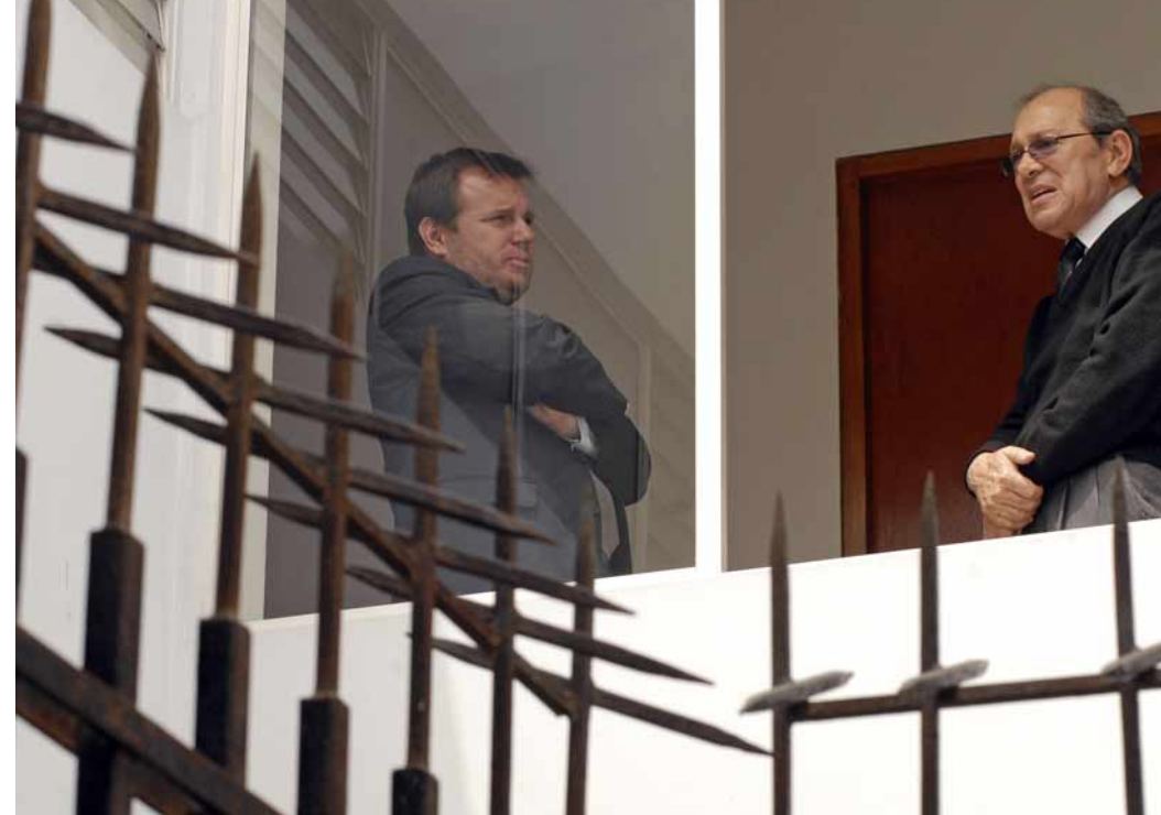
"Procesar el dolor, no recrearse en él de modo permanente, es la única manera de liberarse".

la libertad por la seguridad. Ese es el negocio de todo autoritarismo. Debemos defender la libertad y a través de ella conquistar la seguridad. No a la inversa. Por la seguridad terminamos prisioneros. Ese clima, principalmente en la política, tendría que disiparse. Cuando los políticos han llevado al total descrédito esa dimensión de la existencia, porque la política no es una profesión cualquiera, es la del hombre comprometido con la sociedad y que quiere el bien común; cuando tienen hijas que no reconocen y luego predicán moralidad, que es el caso de un miembro del Comité de Defensa del Congreso; cuando hay políticos que matan perros a tiros, que roban la luz eléctrica o que convierten a sus ayudantes en siervos o esclavos, que roban o mienten; ¿qué se puede esperar de la civilidad que debería tener como ejemplo a los políticos? Es normal que vivamos en una época tan ambigua o desagradable y cosas como me