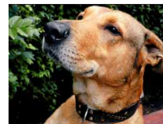
Tino y Zorrita tenían nueve y alrededor de cinco años, respectivamente. Fueron muertos con potente veneno.

penal en Fujimori. Lo que ocurre es que, con poco tino, algunos operadores de justicia involucran a patrullas enteras. El Ministerio de Defensa debería comprender que la única manera de evitarlo es dando los nombres de las personas que las comandaban.