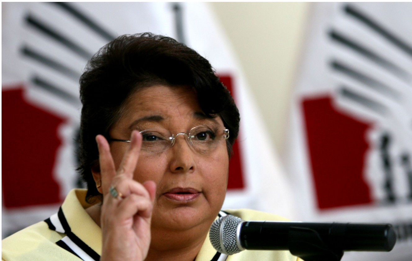
La Defensora del Pueblo, Beatriz Merino.