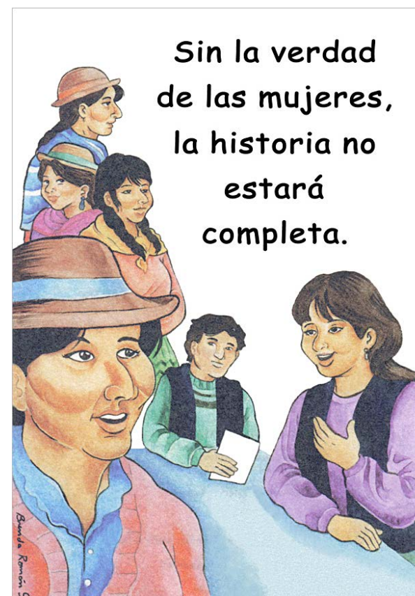
FIGURA 1: Volante elaborado por la LDG para promover el testimonio femenino