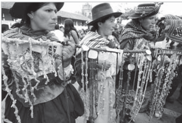
Mujeres con sus quipus de la memoria, recordando que es posible salir de la violencia con un trabajo coordinado por la paz y el desarrollo, pero sobre todo, protegiendo sus derechos humanos.