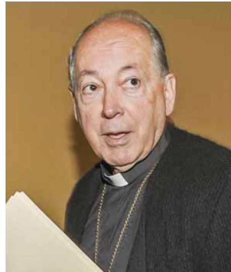
Cardenal Cipriani y el conflicto de la PUCP.

–Es que no hemos querido recordar. Hay quienes dicen "ya no miremos por el retrovisor", estamos creciendo, nos vamos para arriba. Es el fujimorismo y todas aquellas personas que le dan la mano en proyectos de determinada orientación política, de maneras