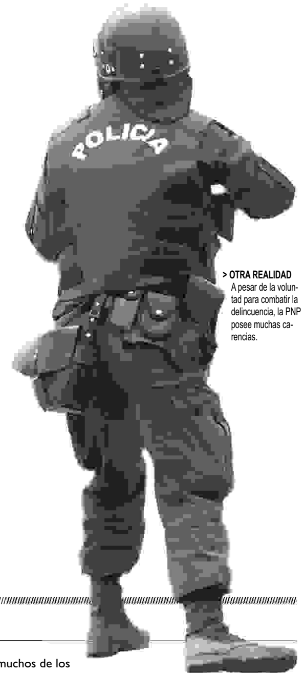
> OTRA REALIDAD A pesar de la voluntad para combatir la delincuencia, la PNP posee muchas carencias.

“Hay que poner manos a la obra, y todos debemos participar”, dice el regidor Zaga Bendejú, e insiste en que la única forma de frenar la delincuencia en la ciudad es que ciudadanos, policía y municipio, trabajen juntos para que no sólo se articulen este tipo de acciones sino que además se adopten decisiones políticas y normas más duras para acabar de una vez por todas con la inseguridad en las calles de Huamanga.