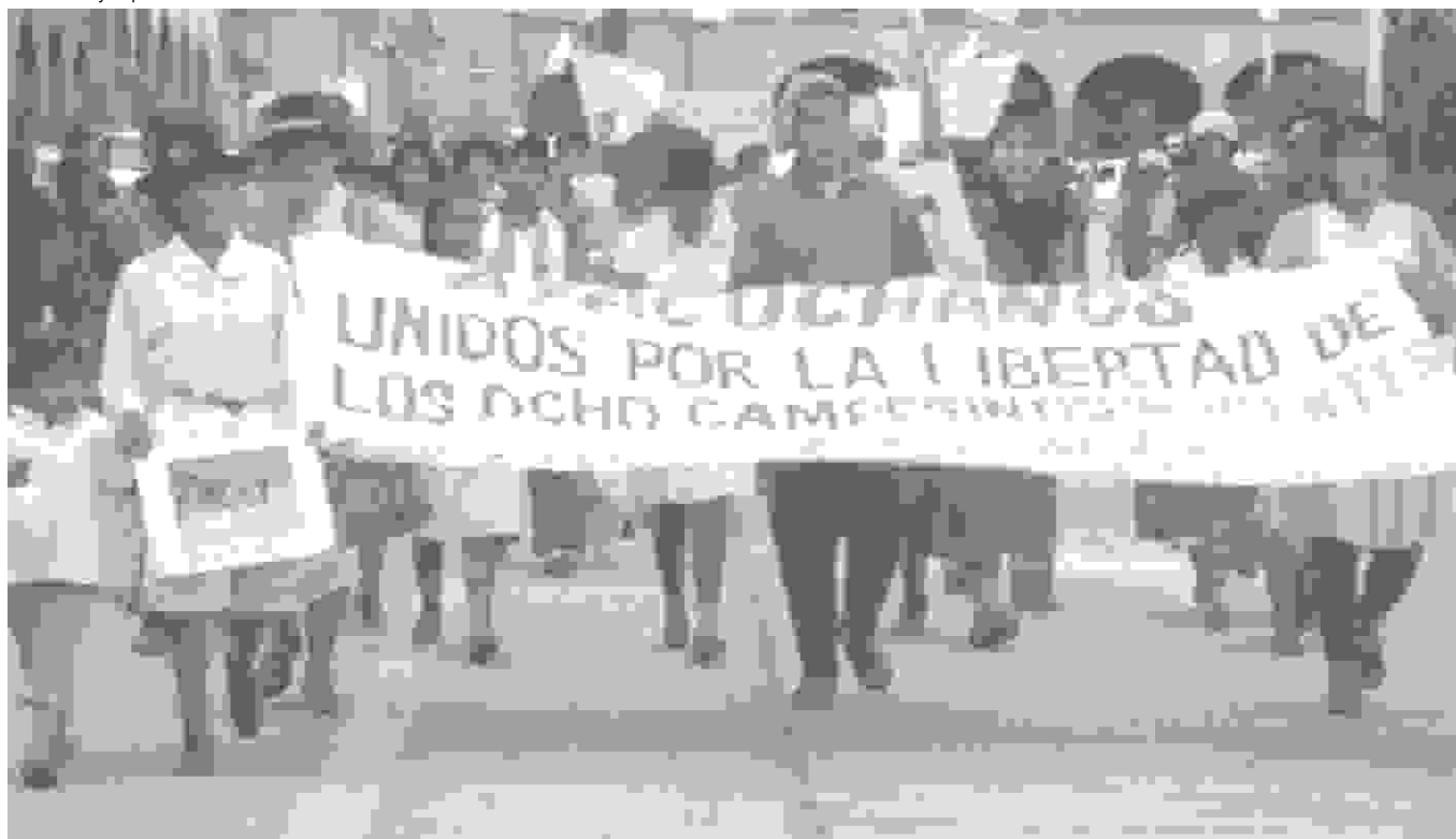
> Familiares de los detenidos se movilizaron por las calles de la ciudad para reclamar la injusta determinación judicial.

sinato de cinco policías y tres civiles en Machente el 18 de diciembre.