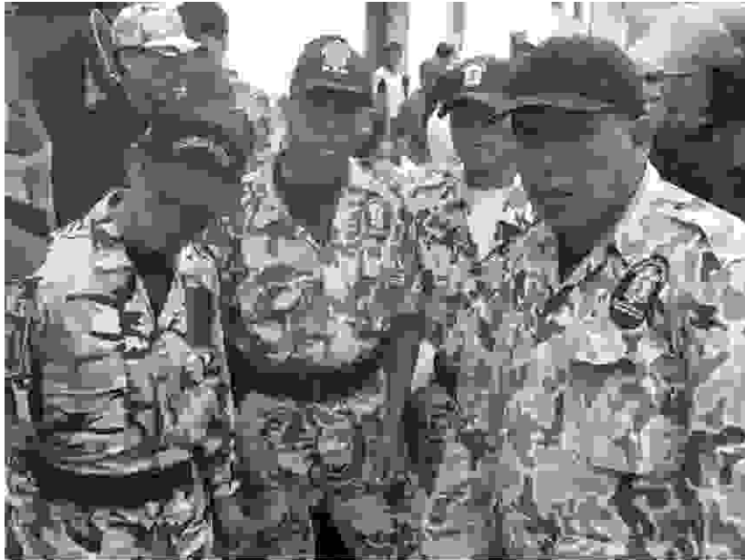
> La cantidad de efectivos del Serenazgo son pocos como para resguardar las calles del centro de la ciudad.