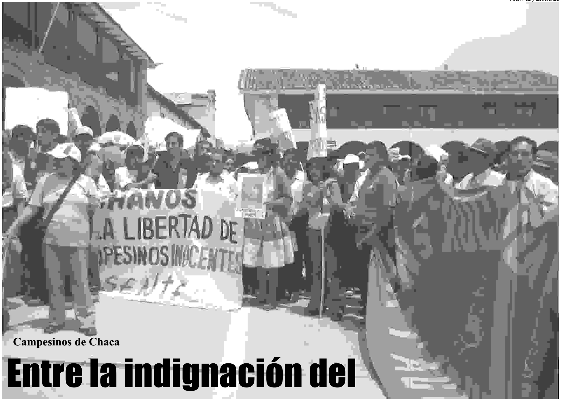
Campesinos de Chaca