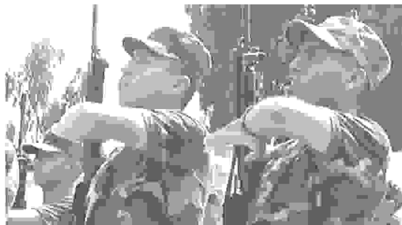
> ¿MILITARIZACIÓN? No parece ser lo que se pretende lograr con el Plan VRAE.

Esa desidia es la que posibilita que los terroristas puedan llevar a cabo ataques que terminen con la vida de policías y civiles, y permite que el narcotráfico siga prosperando.