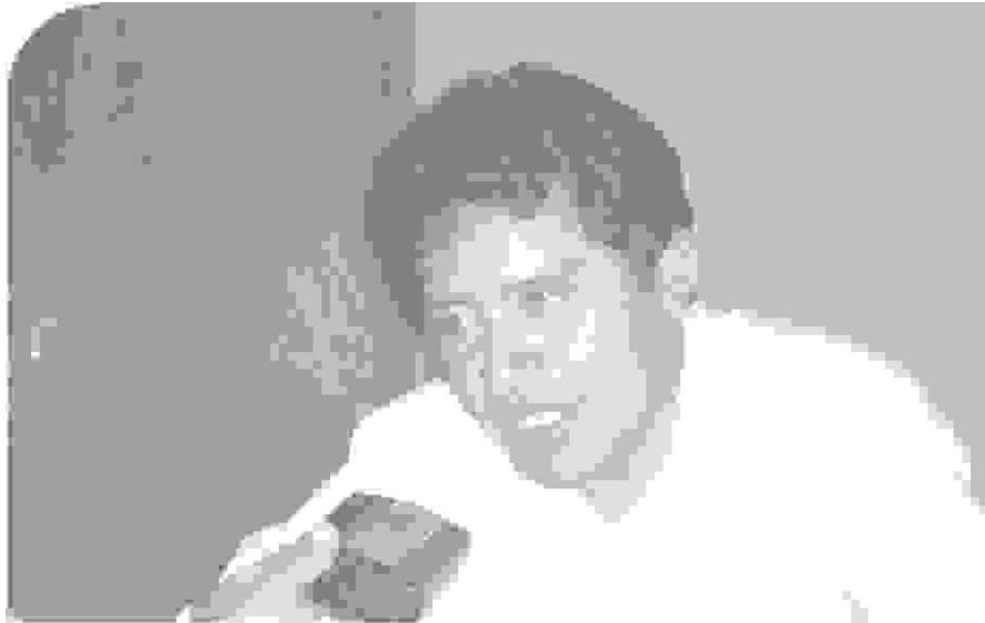
> Edwin Bustíos, Alcalde de la Provincia de Huanca.

“Aquí en la municipalidad no existe una oficina del medio ambiente porque se encuentra desactivada”