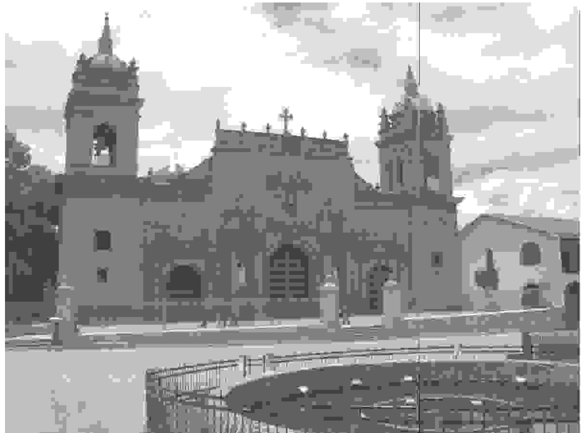
> Basílica Catedral de Ayacucho.