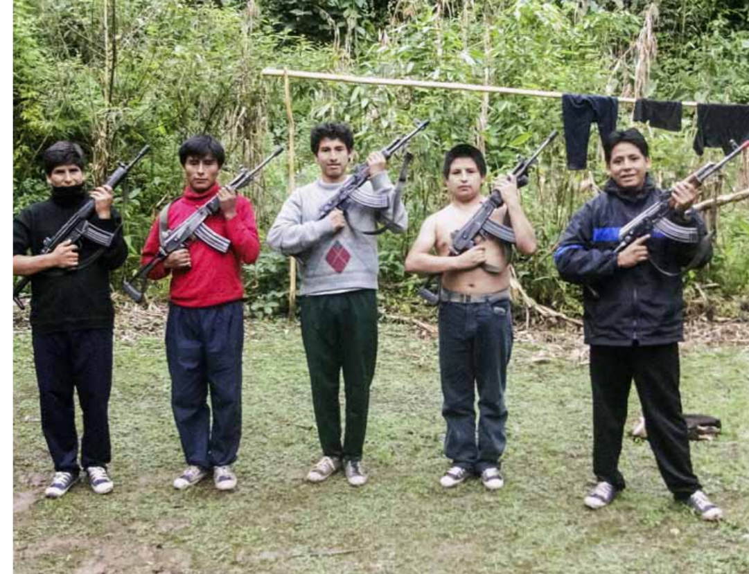
Las fotos de dirigentes estudiantiles en el VRAE, de 2010, dividieron a SL del Movadef.

Los números en la biblioteca le dan la razón: de las últimas 56