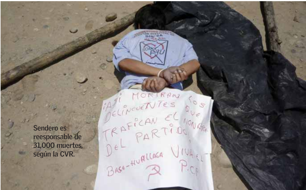
Sendero es reesponsable de 31,000 muertes, según la CVR.