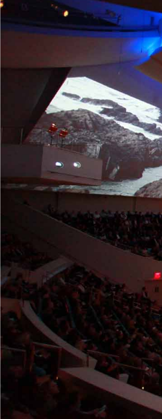
Esta temporada Miami estrenó también el New