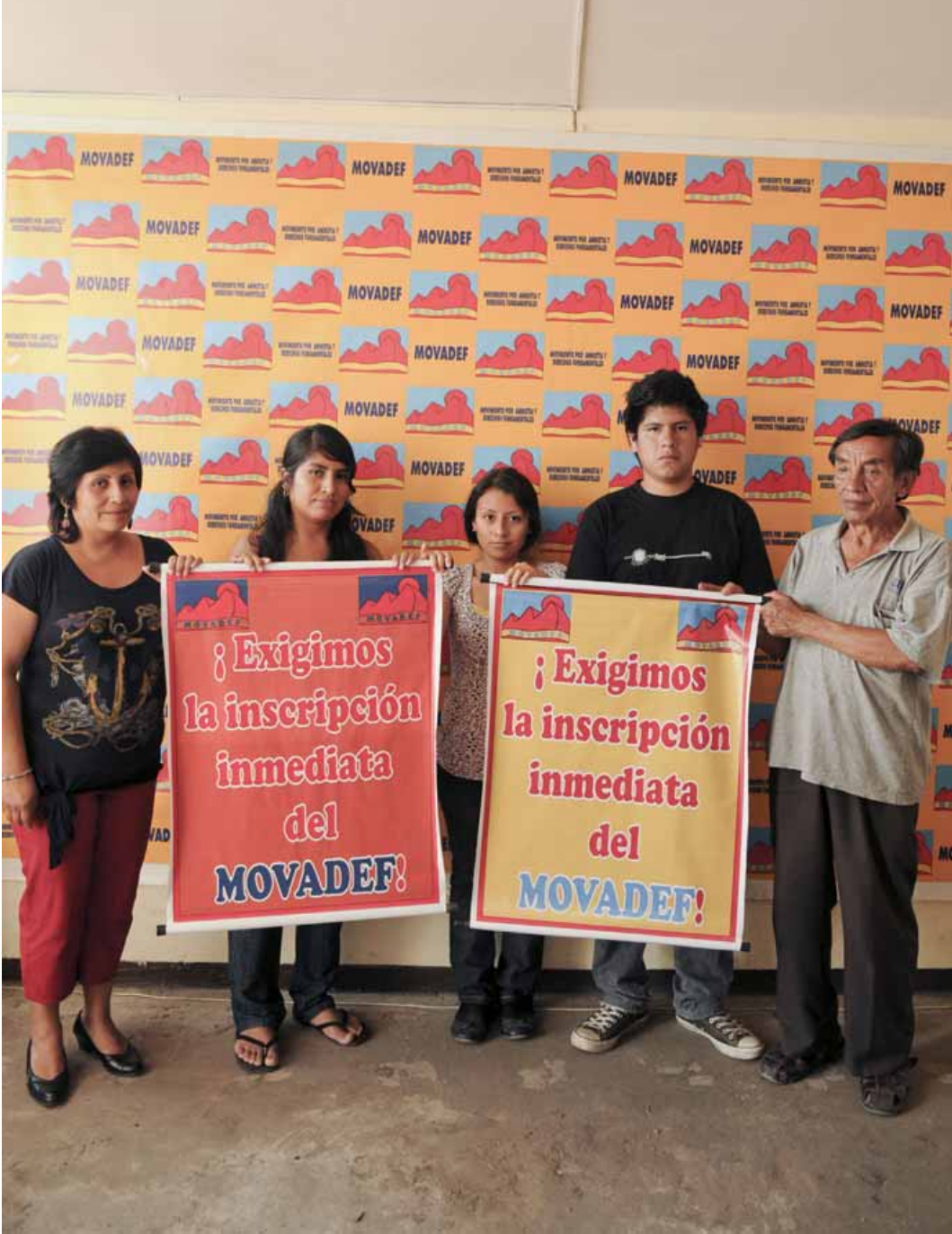
Base del Movadef en SMP. Universitarios aparecen flanqueados por dos ex terroristas.