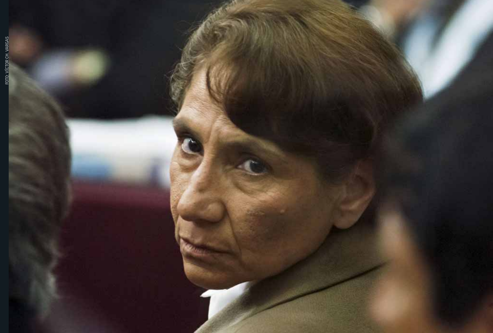
Sedelmayer llevaba los mensajes de 'Miriam' a los mandos de Huánuco y recibía dinero de 'Artemio' (abajo), según la Policía.

Fundadora del Movadef era el enlace entre la cúpula encarcelada y criminales remanentes del Huallaga.