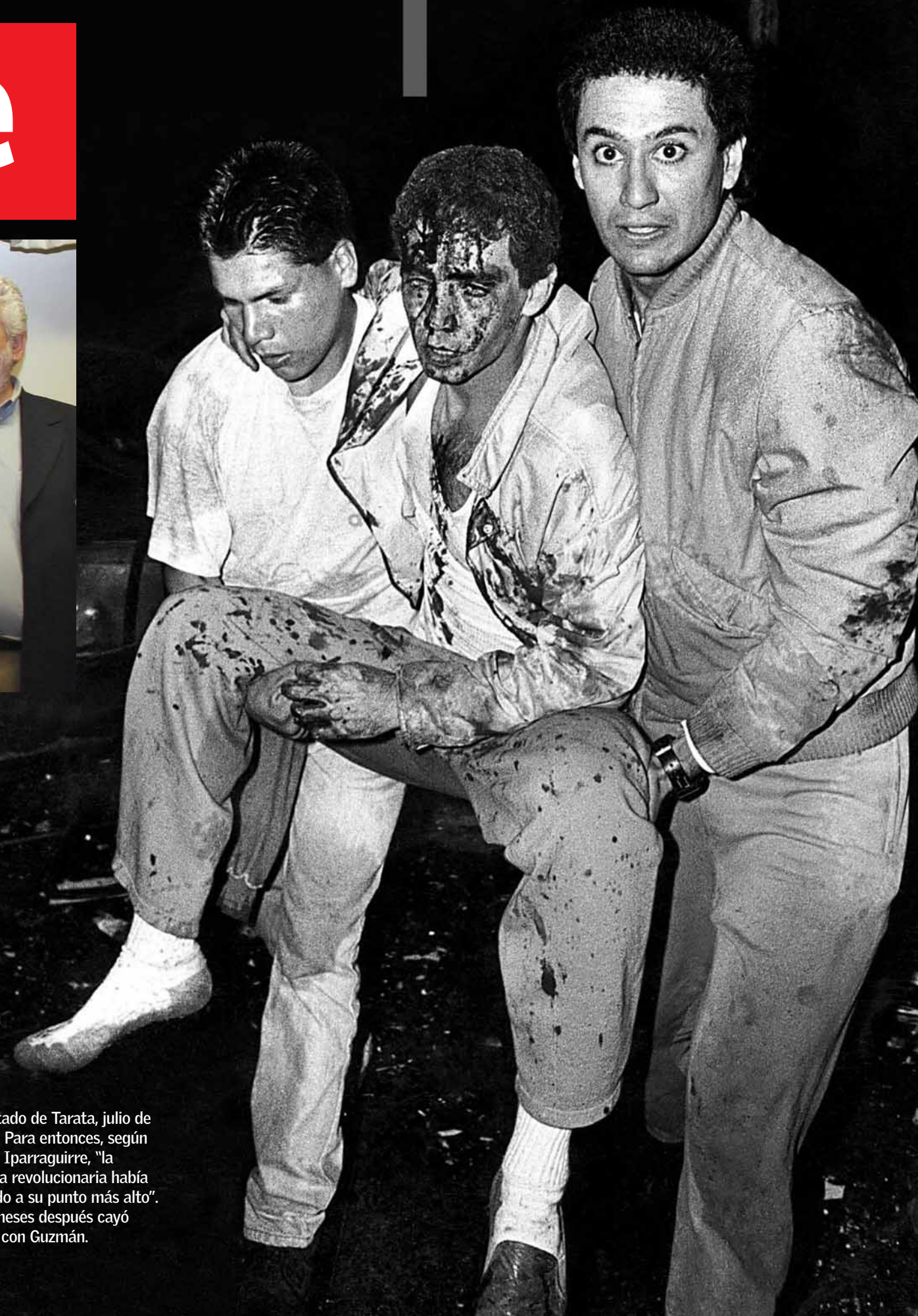
Atentado de Tarata, julio de 1992. Para entonces, según Elena Yparraquarre, "la guerra revolucionaria había llegado a su punto más alto". Dos meses después cayó junto con Guzmán.

E L dogma y la megalomanía característicos de Abimael Guzmán se dejan ver hasta en sus cartas de amor. En la misiva que en 1995 le dedica a su primera esposa, Augusta la Torre o camarada Norah, fallecida en 1988, se lee: