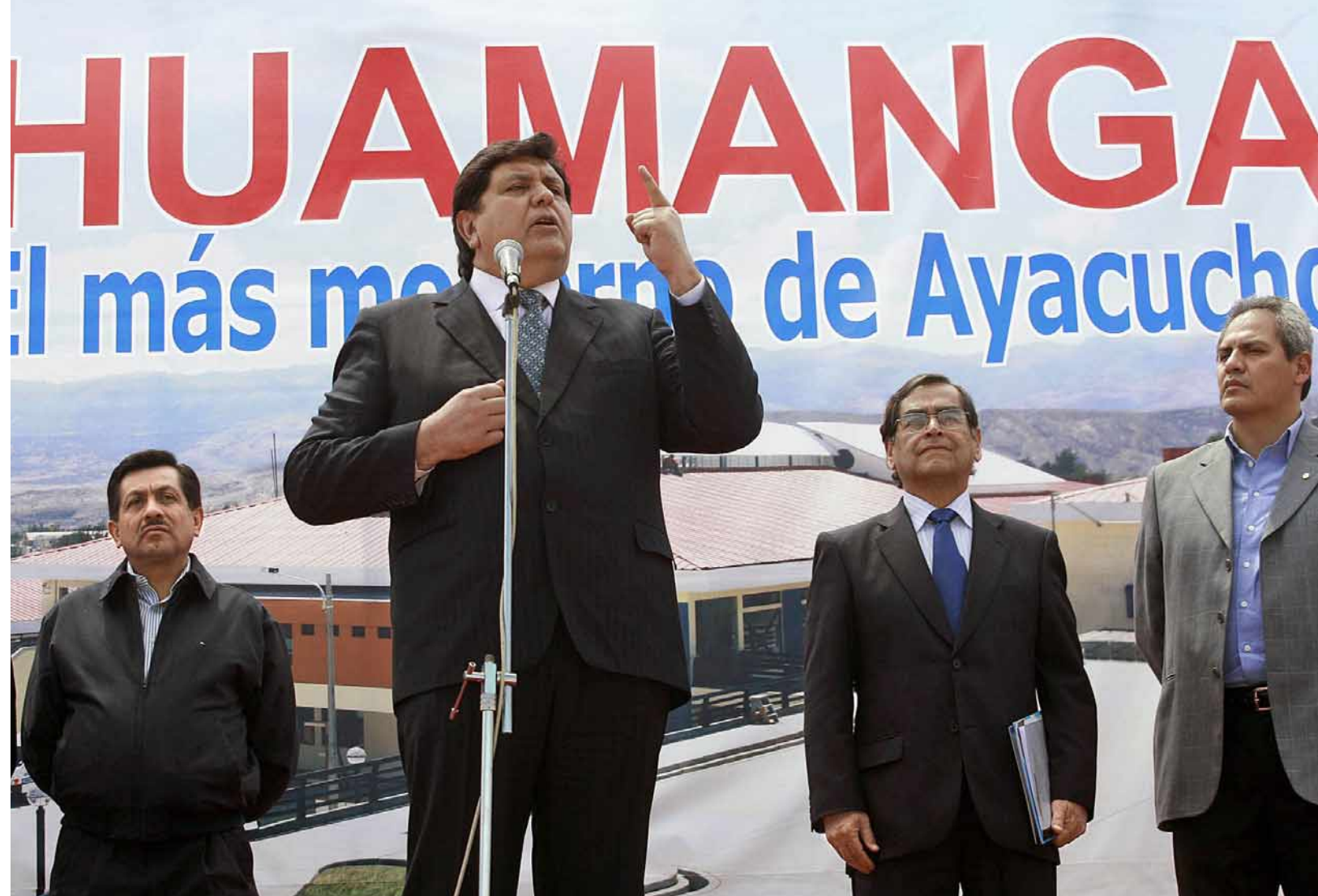
García advirtió el martes 15 sobre radicalismo de algunos medios ayacuchanos durante inauguración de hospital en Huamanga.