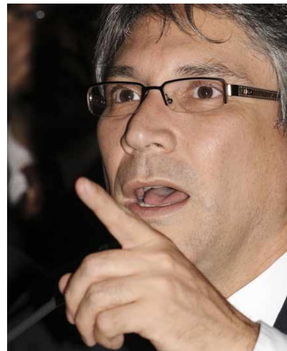
Pastor expuso posición ante el Congreso.

del marxismo mundial. Tiene la pretensión de haber producido un desarrollo teórico que puede servir para las revoluciones futuras”.