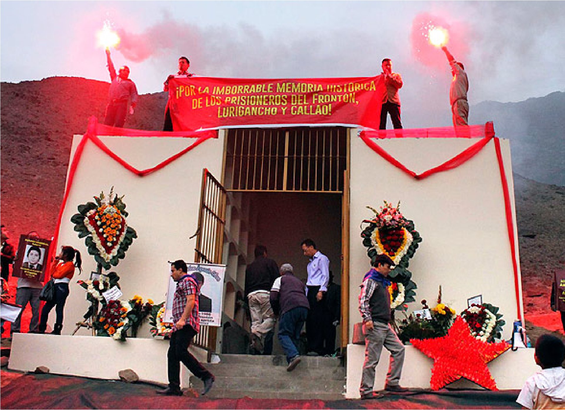
El mausoleo o columbario de SL está ubicado en Comas y alberga los cuerpos de ocho terroristas asesinados en El Frontón.

¿Cómo evitar que un sepulcro sea lugar de peregrinación terrorista? El mausoleo en Comas y el culto a la muerte de Sendero Luminoso.