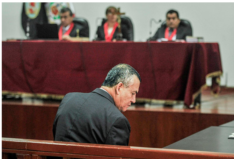
Exministro Daniel Urresti ante nuevo colegiado en audiencia del lunes 3