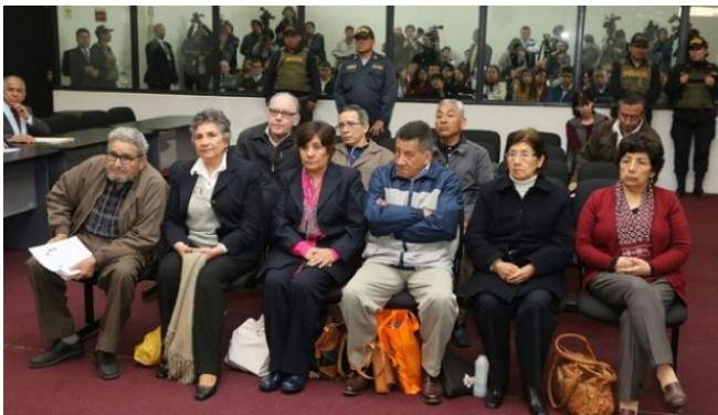
Ayer, el Poder Judicial dictó sentencia contra la cúpula de Sendero Luminoso por el Caso Tarata , a 26 años del atentado en Miraflores que dejó 25 muertos y 155 heridos.

La sentencia en el Caso Tarata constituye un hito fundamental en la lucha contra el terror.