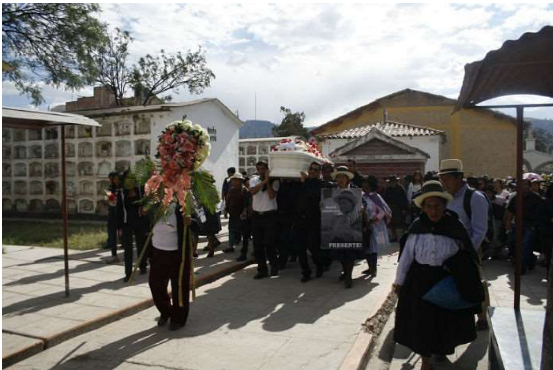
Entierro de 'Mamá Angélica' en Ayauchu.

Juana Carrión, la presidenta actual de ANFASEP, dice entre lágrimas que “ellas creyeron que Angélica era inmortal”. La noticia llegó a la Plaza de Huamanga a las 4 de la tarde. Angélica Mendoza había fallecido de un ataque cardíaco. El corazón enorme de una mujer que luchó 34 años por encontrar la verdad se había detenido.