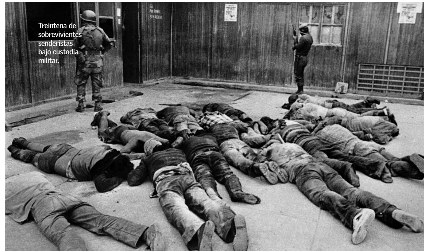
Treintena de sobrevivientes senderistas bajo custodia militar.

Sendero había convertido Pabellón Azul en un búnker con material de construcción proporcionado benévolamente por autoridades.