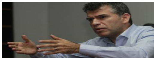
Jaime Saavedra es respaldado por Julio Guzmán y su partido (/politica/826950-jaime-saavedra-es-respaldado-por-julio-guzman-y-su-partido)

(/politica/826950-jaime-saavedra-es-respaldado-por-julio-guzman-y-su-partido)