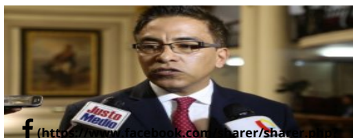
Twitter: polémica por video del congresista Roberto Vieira "pasándose" al lado del fujimorismo | VIDEO (/politica/826838-twitter-polemica-por-video-del-congresista-roberto-vieira-pasandose-al-lado-del-fujimorismo-video)

(/politica/826864-jaime-saavedra-mauricio-mulder-debe-regresar-al-colegio)