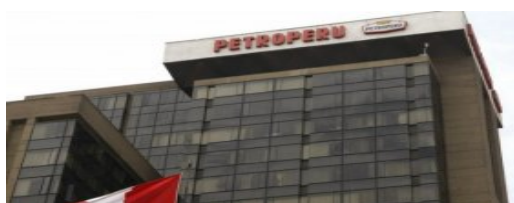
Petroperú: estos son los integrantes de nuevo directorio (/politica/826942-petroperu-estos-son-los-integrantes-de-nuevo-directorio)

(/politica/826950-jaime-saavedra-es-respaldado-por-julio-guzman-y-su-partido)