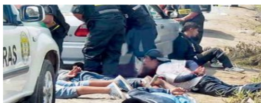
Congreso aprueba ampliación del plazo de detención preventiva (/politica/826917-congreso-aprueba-ampliacion-del-plazo-de-detencion-preventiva)

(/politica/826942-petroperu-estos-son-los-integrantes-de-nuevo-directorio)