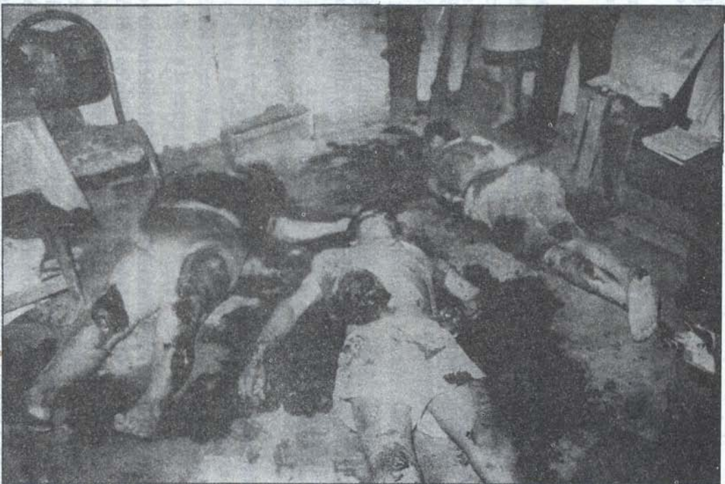
Sendero ha cometido los crímenes más salvajes de la historia del Perú. Algunos de ellos fueron planificados por el propio Abimael Guzmán