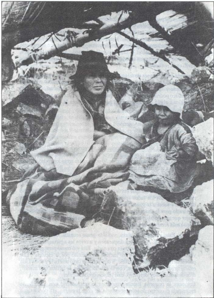
Los huérfanos de Ayacucho constituyen un grave problema