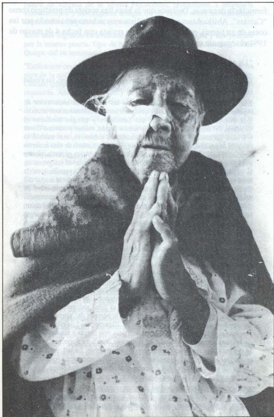
Su esposo, sus hijos, sus nietos. . . asesinados por SL