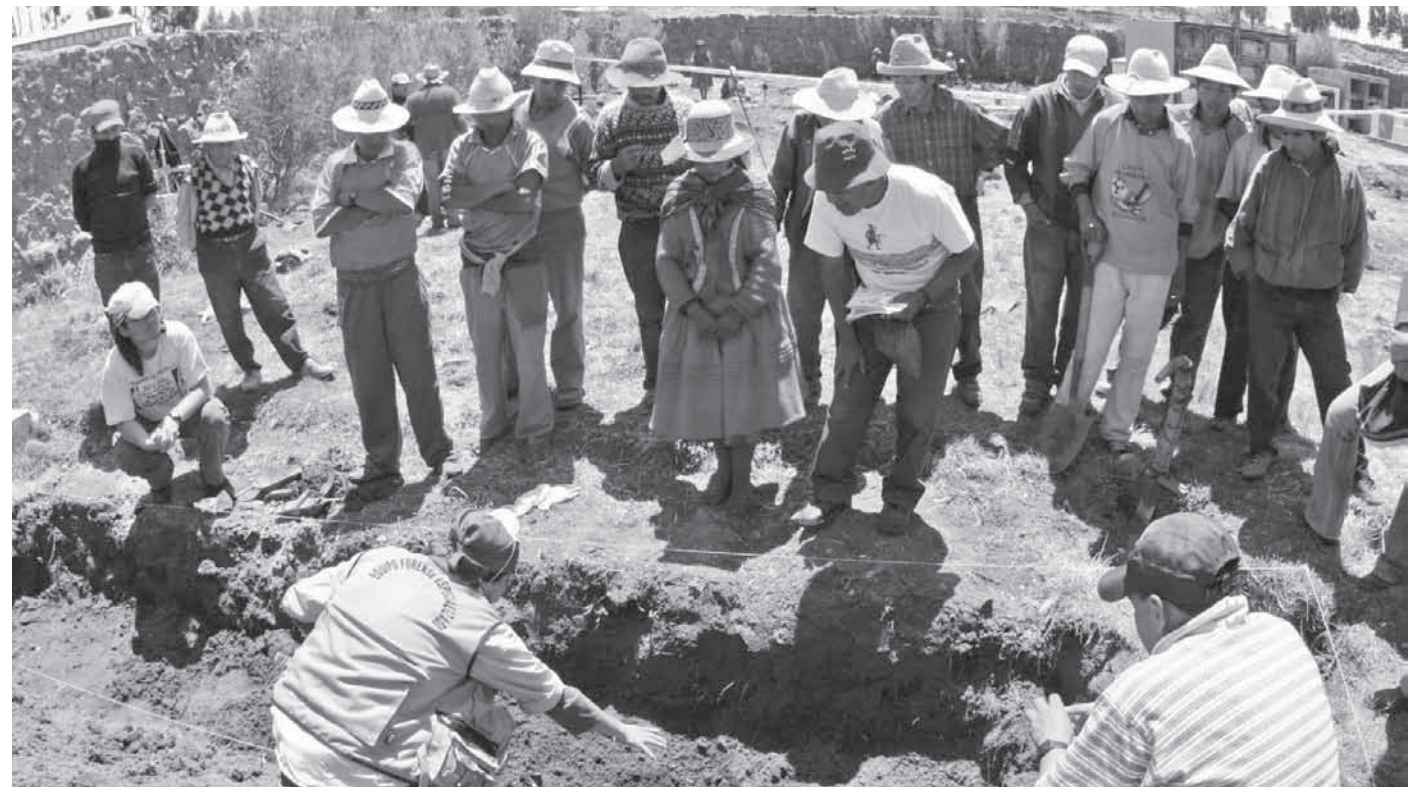
La violencia política y el escenario postconflicto es abordado por las ciencias sociales en dos publicaciones indispensables.

Lo dicho trae a colación la publicación de dos textos que exploran el proceso histórico contemporáneo de la región de Ayacucho: “Las formas del recuerdo: etnografías de la violencia política en el Perú”, editado por Ponciano del Pino y Carolina Yezer (Lima: Instituto de Estudios Peruanos; Instituto Francés de Estudios Andinos, 2013, 307 pp.), y “Entre la región y la nación: nuevas aproximaciones a la historia ayacuchana y peruana”, editado por Roberto Ayala Huaytalla (Lima: Instituto de Estudios Peruanos, Centro de Estudios Históricos Regionales Andinos, 2013, 309 pp.). Ambos, publicados el año pasado, incorporan el protagonismo político-social de los campesinos ayacuchanos en dinámicas regionales que forman parte de las circunstancias y transformacio-