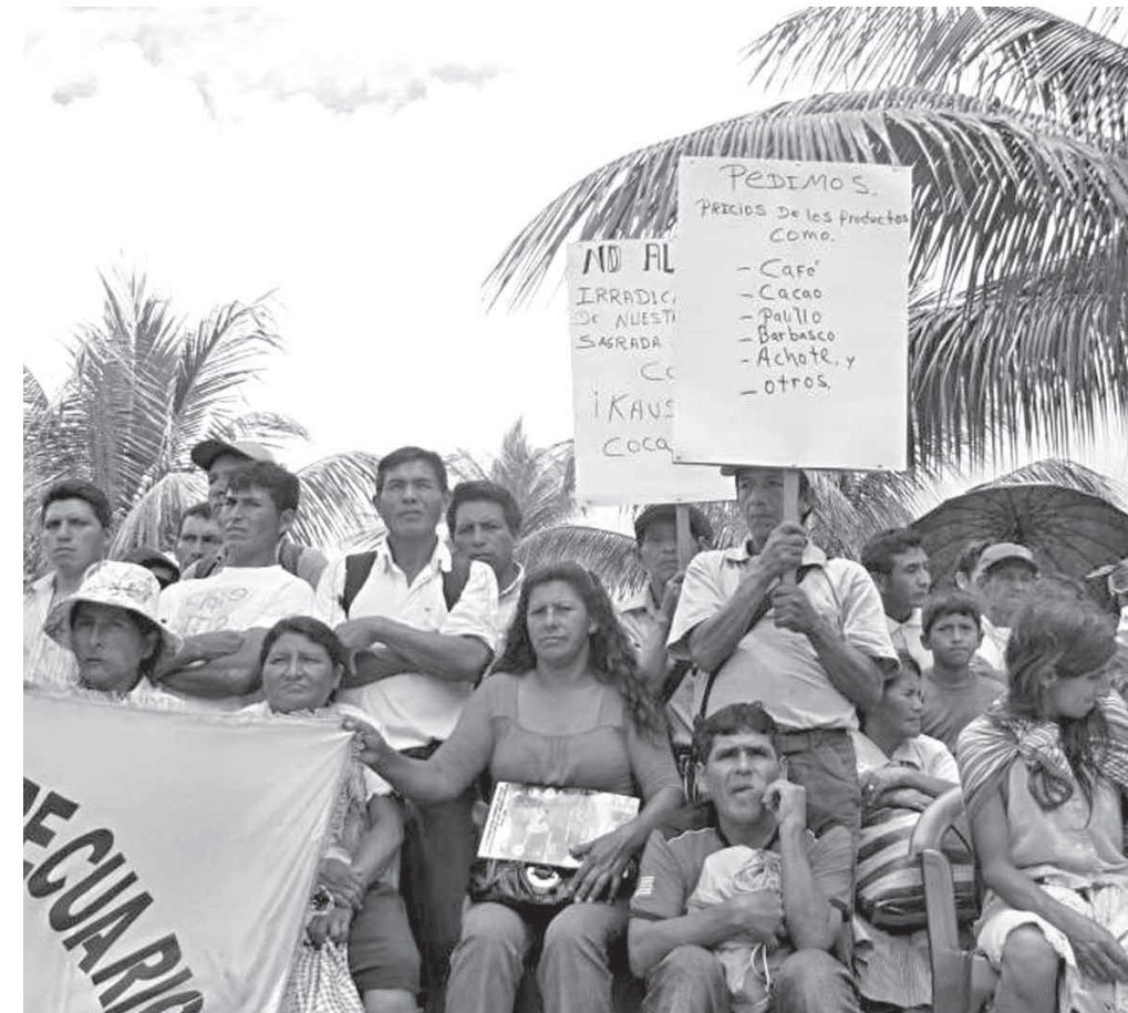
Productores cocaleros durante congreso dejaron muy bien sentada su posición contra la erradicación.

Vásquez también refiere que las municipalidades y los gobiernos regionales que tiene