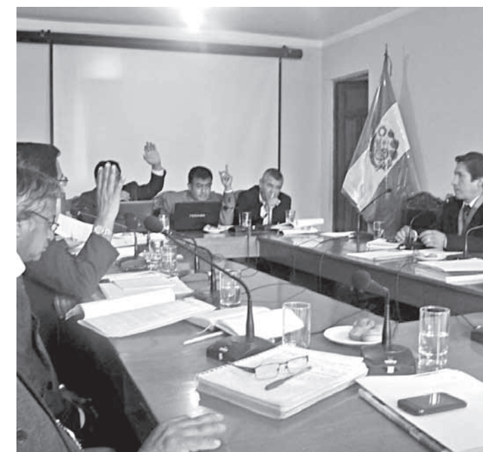
Histórica sesión en la que se aprobó el Plan Regional de Reparaciones.

Teniendo en cuenta este panorama, implementar el PIRRA en Ayacucho permitirá contribuir en darle una mejor y mayor sostenibilidad al proceso postviolencia. Un aspecto que se debe destacar del documento es que reafirma que su implementación desde el GRA seguirá los procesos establecidos por la CMAN, para implementar las recomendaciones de la CVR.