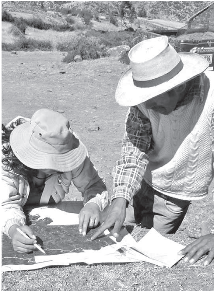
Con el proceso de ZEE, Ayacucho va camino a concretar su ordenamiento territorial.

Lo que estamos haciendo a nivel de la gerencia para implementar esta ordenanza regional es trabajar en la elaboración de una directiva y en un lapso de un mes tendremos la misma y la distribuiremos en todas la instancias del GRA para que empiecen a trabajar sus inversiones de acuerdo a estos estudios de ZEE.