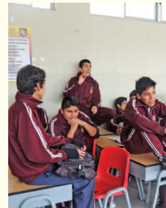
Los niños y niñas adolescentes son frecuentes víctimas de bullying.

Sí, la infraestructura y el mobiliario son importantes; pero más importante son las personas que las utilizan. Por ello, tanto el ministerio de Educación, como la DREA deberían de realizar acciones para enfrentar la discriminación, el racismo y la violencia que subsisten en las instituciones educativas de Ayacucho.