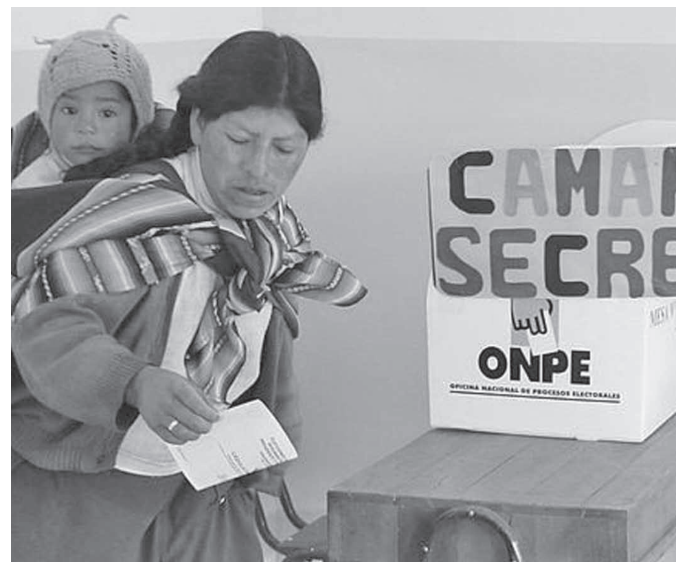
Los cambios en el mundo rural han incrementado la participación de la mujer en las elecciones.

Una primera tendencia es que en el campo hay un 20% de ausentismo. Esos que no